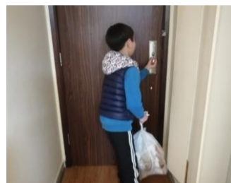
各同學十分注重家居衛生，做得好呀！

轉眼間，同學們 可以復課了 ！雖然疫情嚴峻，但衷心感謝多馬校董會、多馬教育慈善基金各校友及家長教師會的支持和幫助，同時感謝教職員緊守崗位，為面授課作預備和安排。願主祝福各位老師、職工、同學及各位家人身體健康，彼此互相守望，平安渡過疫情。