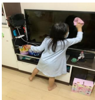
各同學都盡力完成家務，又乖又叻！