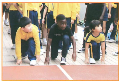
來一次跑步比賽，友誼第一。