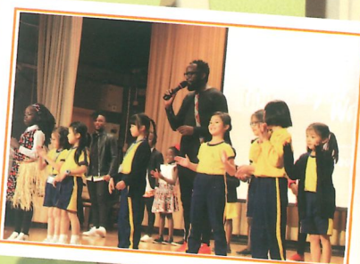
表演精彩，更有不少互動與合作。