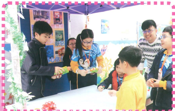
會場內有各式各樣的攤位