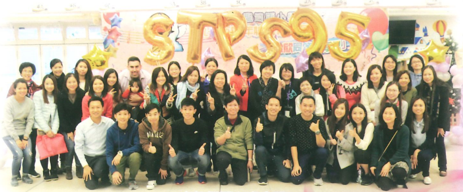
老師們開心大合照