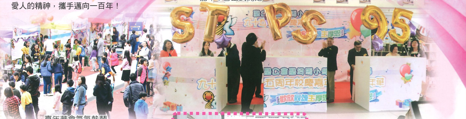
嘉年華會氣氛熱鬧