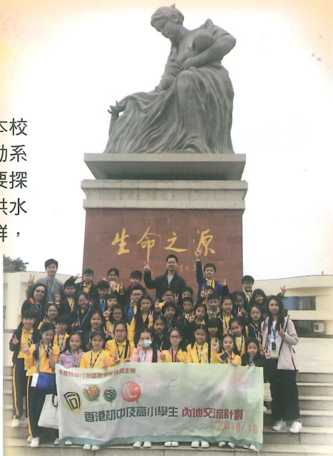
同學參訪東深供水工程，認識食水從內地輸入香港的途徑。