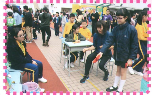
遊戲令人樂在其中

嘉年華會氣熱鬧，當日有各科組及合作機構的攤位遊戲、充氣彈床，亦有美味小食及玩具義賣，籌得之捐款，扣除開支後，將用作支援學校持續發展，改善校內閱讀環境之用。同場亦為聖基道兒童院舉行朱古力義賣，為有需要的人送上關懷。