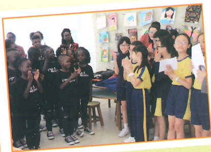
透過有趣的活動，彼此認識。

本年度我們繼續支持WATOTO計劃，助養烏干達孤兒。WATOTO合唱團的小朋友本年亦有到校探訪我們，與同學一起共進午餐，並於午息時段與同學一起玩耍，相處愉快。他們更為同學演出充滿活力的歌舞，透過音樂傳揚福音，把喜樂帶給大家。