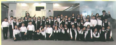
2018香港青年音樂匯演-管樂團比賽 銅獎