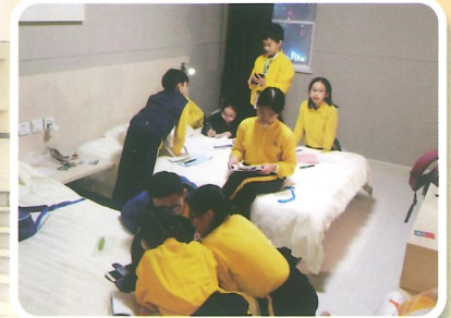
同學認真參與各項學習活動，表現良好，大家相處融洽，晚上在酒店還進行反思分享會。