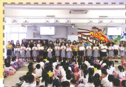
敬師日早上，同學親手送上紅蘋果，感謝老師們的關心和教導。