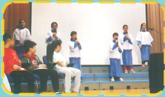
詩班為我們獻唱詩歌