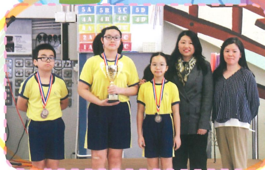
魔力橋數學棋小學邀請賽獲獎同學