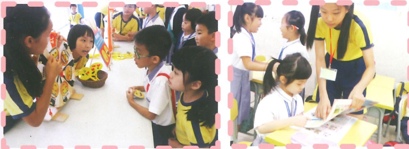
同學投入「正向品格在多馬」攤位活動，努力學習24個品格強項。