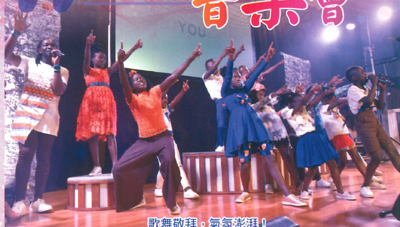
歌舞敬拜，氣氛澎湃！