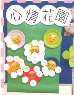
小一同學在成長課中，學習不同情緒詞彙，每天也為心情花園紀錄自己的心情。