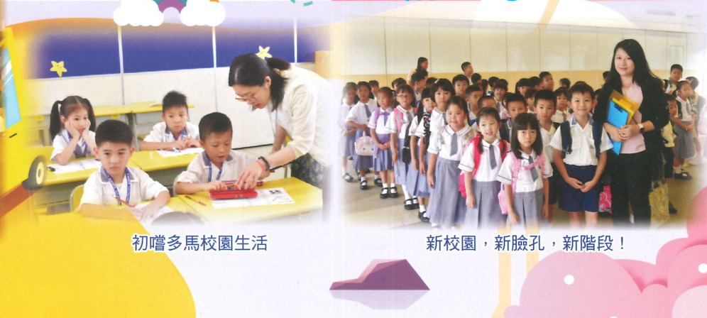
初嚙多馬校園生活