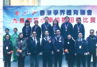
九龍西區小學校際田徑比賽女子甲組4x100米冠軍