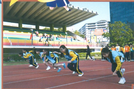
健兒們，勇往直前吧！