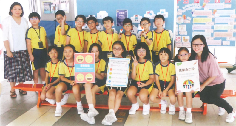
我們一班好心情大使同學在校舉行「品格正向在多馬」攤位遊戲，推動正向文化。