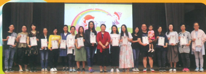
爸爸媽媽完成了家長學堂課程，獲頒證書