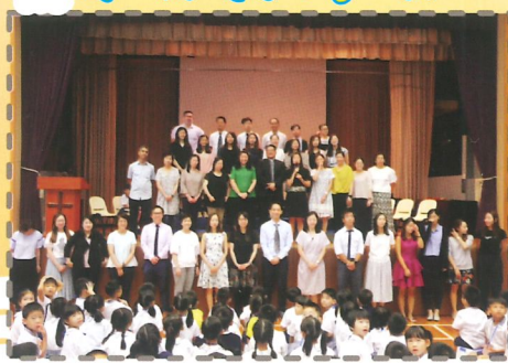
老師們開學大合照