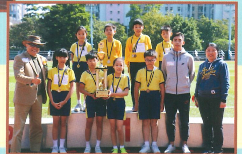
齊心合力，創造佳績