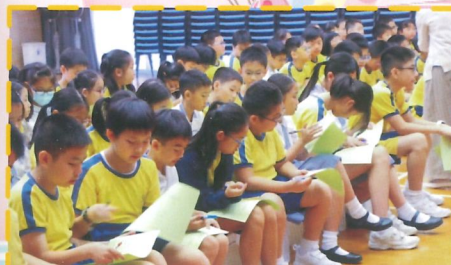
同學們認真受訓，為擔任友愛大使作好準備。

為了幫助新入學的小一同學適應新環境，一眾哥哥、姐姐化身為愛心天使，擔任友愛大使，照顧新入學的小一同學。