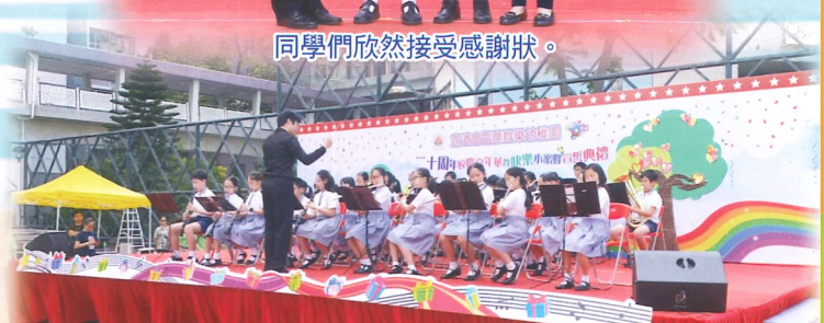
同學們傾盡全力的演出，十分精彩。