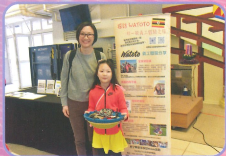
知多一點點：會後進一步了解 Watoto 理念