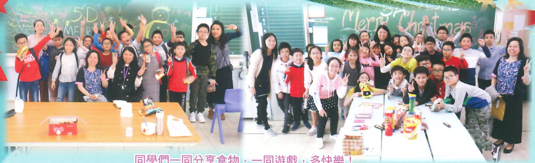
同學們一同分享食物，一同遊戲，多快樂！