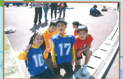
齊為4x100接力賽，加把勁！