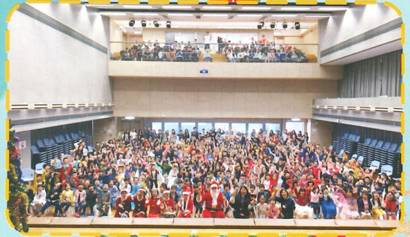
在這普天同慶的日子，多馬師生一同慶賀主耶穌的降生