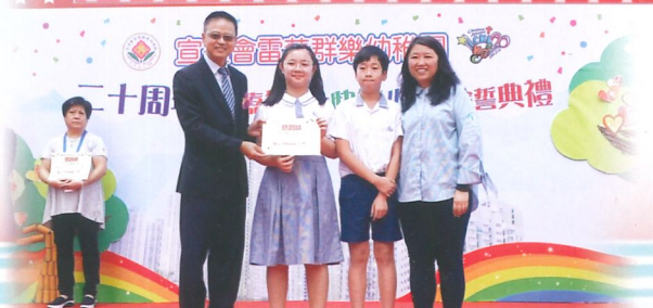
同學們欣然接受感謝狀。

踏入11月份，成長吹化劑的同學為宣道會雷蔡群樂幼稚園二十周年校慶嘉年華暨快樂小蜜蜂宣誓典禮進行表演。