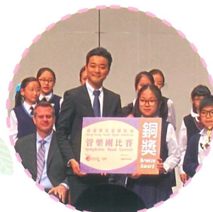
香港青年音樂匯演 金管樂團比賽銅獎