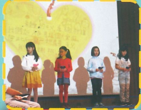
各班代表獻上祝福