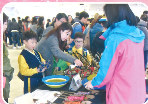
學生家長正挑選紀念品呢！