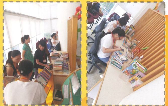
家長義工協助整理圖書