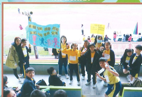
各班齊心為比賽健兒落力打氣