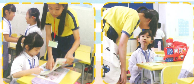
每一位友愛大使都很有耐性協同學。

為了幫助新入學的小一同學適應新環境，一眾哥哥、姐姐化身為愛心天使，擔任友愛大使，照顧新入學的小一同學。