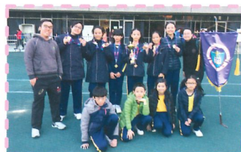
我們的喜悅是努力不懈的結果， 願與關心多馬的你一同分享