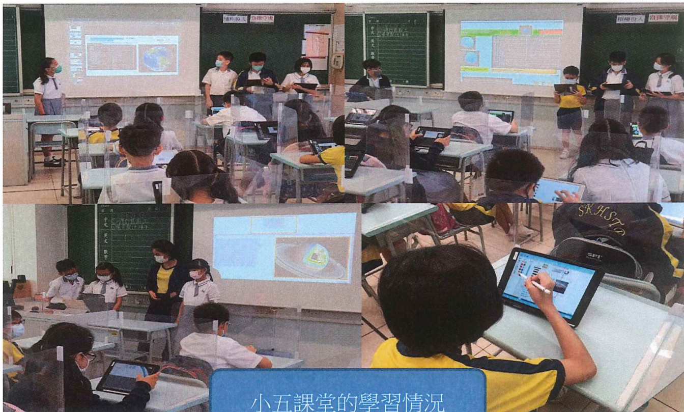
小五課堂的學習情況

10月19日隨著小五學生開展嶄新的學習模式 - 帶 iPad 回校上課。他們在常識課使用電子課本(影片、網址、互動練習及即時評估練習)及在 IT 課也使用網上平台學習，亦透過 Google Classroom 來發放作業，讓學生在課堂進行分組習作、閱讀網頁後的工作紙及請學生在家中拍攝小實驗的進行過程等多元化的學習方法，拉闊了及加深了學習的範圍及深度。三位常識科及 IT 科科任老師都認為學生已掌握了使用 iPad 的基本守則及初步的技巧；同時已通知了小五的班主任，當他們進入課室後，同學可以取出 iPad 來閱讀早禱宣佈和電子圖書。