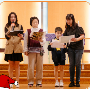
1B班 學生家長及老師們