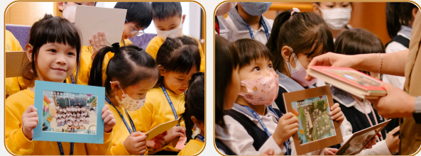
1A班 學生家長及老師們