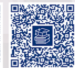
多馬教育慈善基金